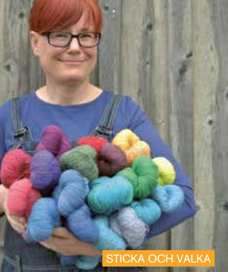
STICKA OCH VALKA