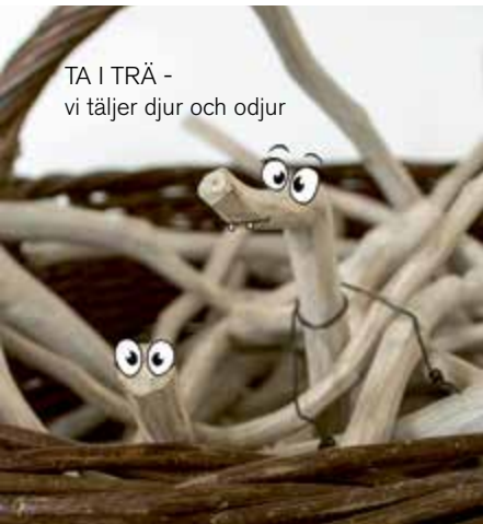
TA I TRÄ - vi täljer djur och odjur

mingel för träslöjdsintresserade. Minimiålder 13 år. Läs mer på sid 4. Anmälan krävs och görs på hemslojdeniskane.se/taljfest2019 I samarbete med Falsterbo Strandbad och Skånes Hemslöjdsförbund