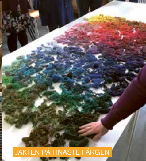
JAKTEN PÅ FINASTE FÄRGEN