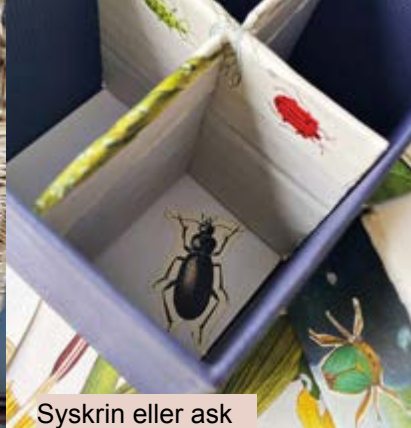
Syskrin eller ask