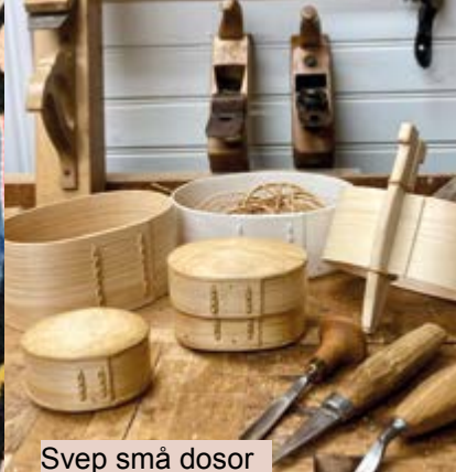
Svep små dosor