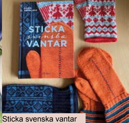
Sticka svenska vantar